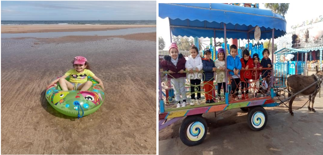
Photos des sorties des enfants

Le soutien des enfants et la prise en charge renforce la capacite des parents .nous comptons sur votre aide pour soulager aussi les mamans en leur offrants des focus groupes et des groupes de paroles .